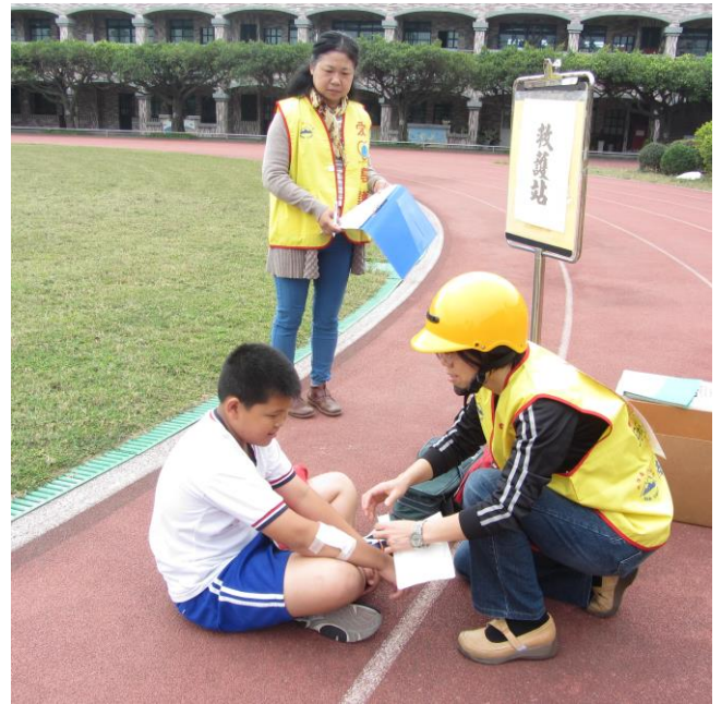
火場救出受傷學生