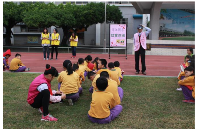
校長解說發生地震與火災時避難之注意事項