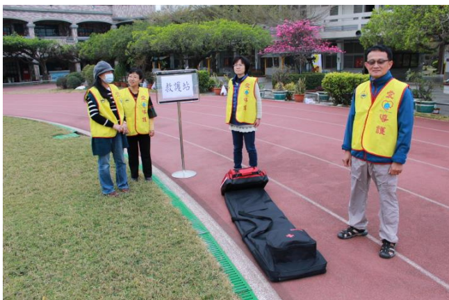
教師穿著各組背心(救護組)