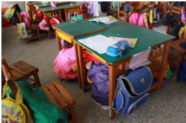
就地掩護(趴下、掩護、穩住)