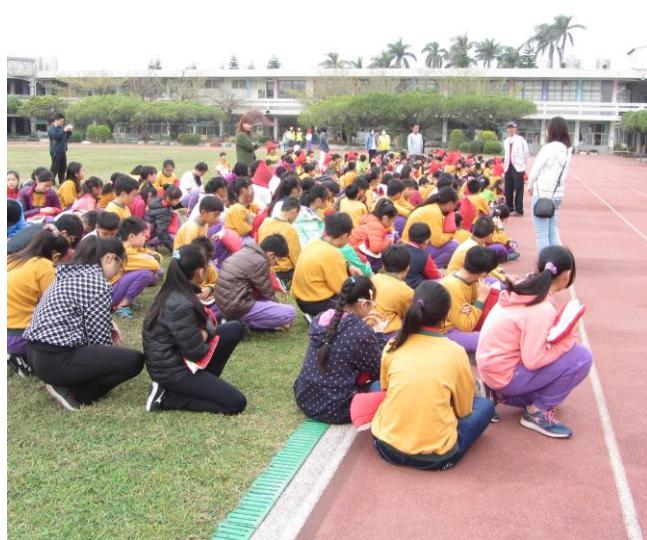
災害避難疏散圖地點